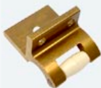
Gâche Equerre Laiton LB4103