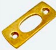
Gâche Feuillure Laitonnée LB4101