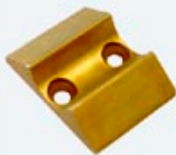
Gâche Arrêt Laiton LB4102