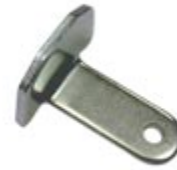
Coudé 2 trous