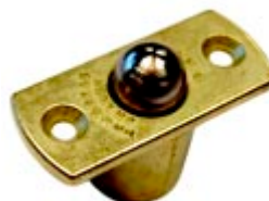
Loqueteau D25 Laitonné