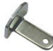
Abgewinkelt 2 Löcher