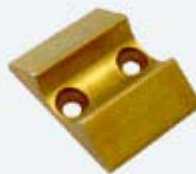
Kugelraste mit Anschlag Messing LB4102