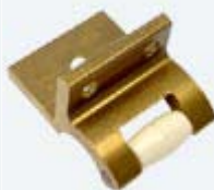
Kugelraste Winkel Messing LB4103

Kugelrasten für Schnäpper D25 Messingné :