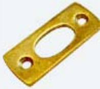
Kugelraste mit Falz vermessingt LB4101