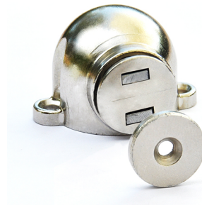
Vernickelt, zum Einlassen